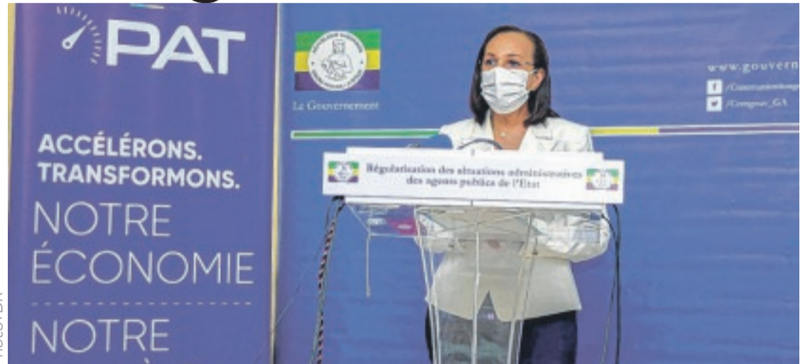
Le ministre de la Fonction publique Madeleine Berre face à la presse hier.

La ministre de la Fonction publique a tenu à rassurer que toutes les situations administratives vont continuer à être prises en compte, avec une ouverture sur les autres pans de ce processus de régularisation que sont, par exemple, les avancements automatiques. Nous y reviendrons.